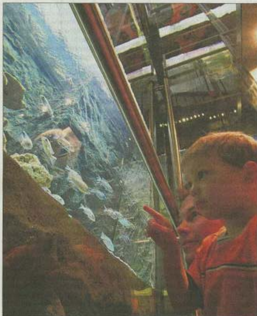
■ Erlebnisreise im Lift. Während der Fahrt durch die Aquarien-Landschaft ist der pneumatisch-hydraulische Lift angemessen langsam, nachher schneller.