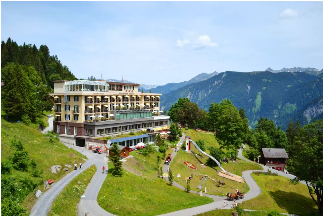
Das Märchenhotel Braunwald liegt im gleichnamigen Ort auf 1300 Höhenmetern. Märchenhotel Braunwald